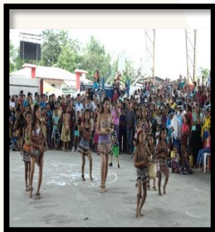
TEATRO POPULAR PARA NIÑOS "PEQUEÑOS TRAVIESOS TRES DE NOVIEMBRE 2018".