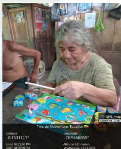
Foto N° 6 Visita domiciliaria comunidad 25 de Diciembre Realización de actividad didáctica pesca de animales.