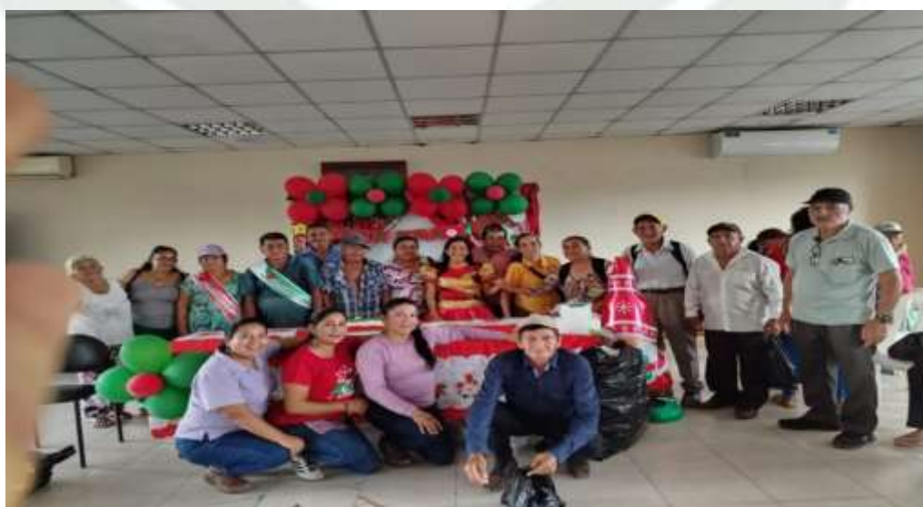
Foto N°2 Agasajo Navideño con los usuarios de las tres unidades de atención