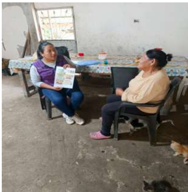
Foto 6: Charla educativa sobre Actividades Básicas de la Vida Diaria.