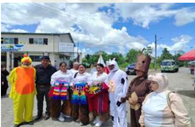
Foto 16: Participación en el pregón cultural con las Personas Adultas Mayores.