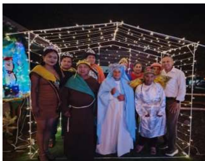
Foto N°1 Presentación del pase del niño con las personas adultas mayores.