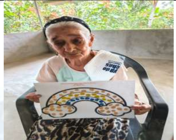
Foto 4: Actividad lúdica, rellenar imágenes con bolas de plastilina.