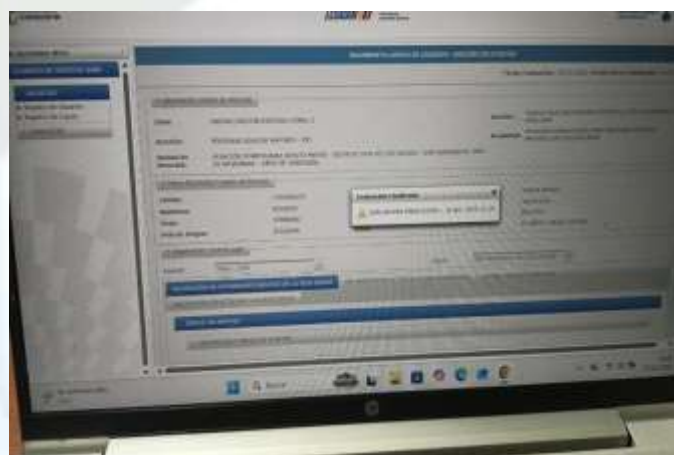
Foto 13: Registro de las fichas gerontológicas en la plataforma SIIMDH.