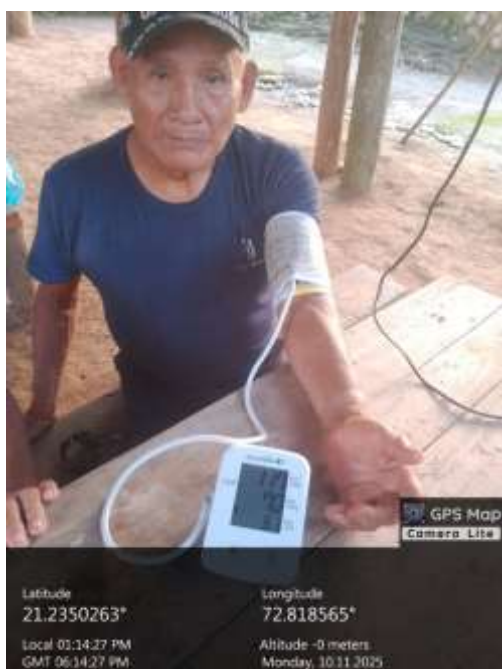
Foto N°8 Visita Domiciliaria Realización de ejercicios según condición de cada adulto mayor